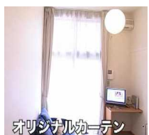
オリジナルカーテン