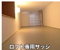
ロフト専用サッシ