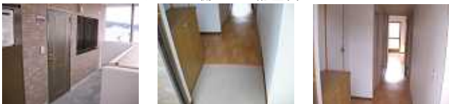
バルコニー側からの配置図