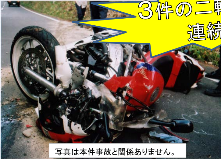
写真は本件事故と関係ありません。