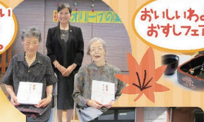
おいしいあよ〜 お寿司フェア