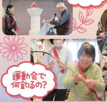
運動会で 何釣るの?