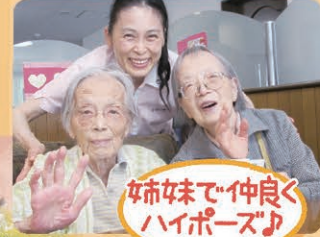
姉妹まで仲良く ハイポーズ♪