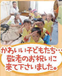
かわいい子どもたち... 敬老のお祝いこ 来て下さいました。