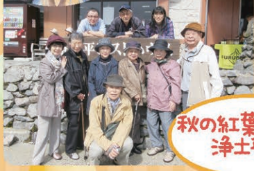
秋の紅葉ドライブ 浄土平へ