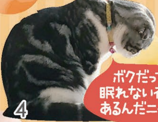
ボクだって 眠れない夜も あるんだニャー